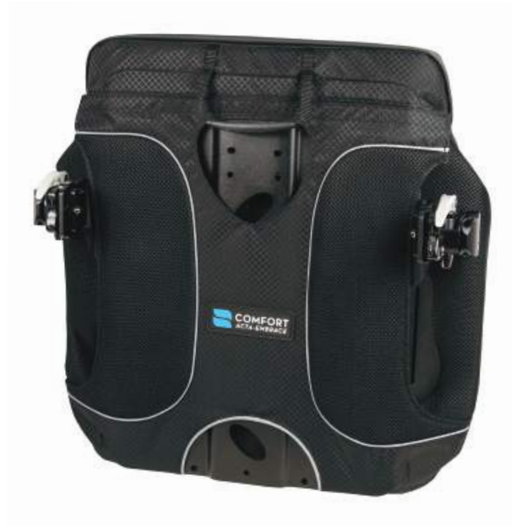
Hardware 2 Pontos Compass® 4 Quick Release

Instalação do Hardware Compass® 4 (Quick Release e Fixo, 2 e 4 Pontos) em Acta-Embrace™ e Acta-Embrace™ LTS